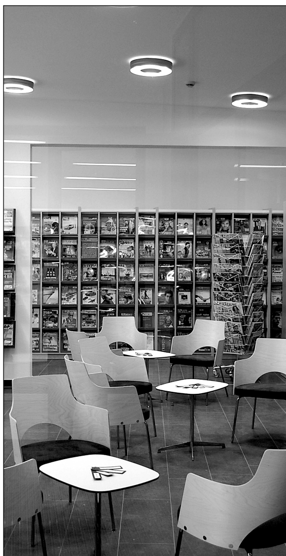
Die Stadtbibliothek der Hansestadt Stralsund nach der Sanierung: Blick durchs Fenster in einen der neuen Leseräume